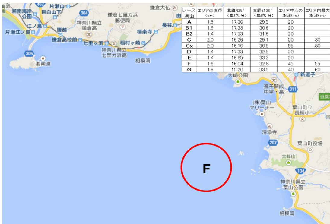
【添付図 B】 レース・エリア